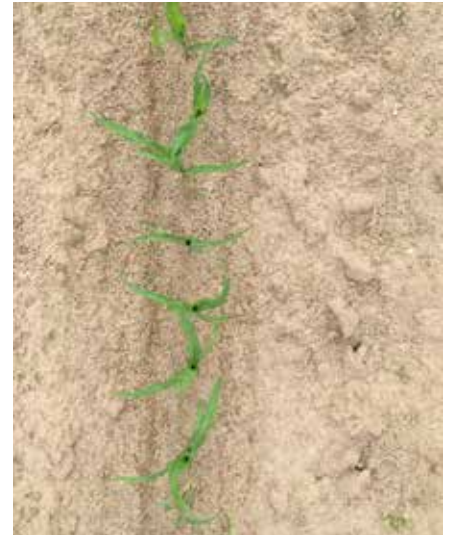
Indien vroeg gespoten, geeft Calaris (terbutylazine) een zeer belangrijke bijdrage aan de bestrijding van ooievaarsbek. Links: tembotrione 1,5 l/ha. Rechts: tembotrione 1 l/ha + Calaris 1l/ha.

Ooievaarsbek komt vooral voor op zandgronden en de bestrijding vraagt om terbutylazine. Op percelen met ooievaarsbek is het advies daarom altijd Calaris. Daarnaast geven bodemherbiciden een goede extra bijdrage. Dus kies indien mogelijk voor een vroeg ras en zaai het vanggewas na de oogst van de maïs. Dan kunt u prima gebruik maken van Frontier Optima als bodemherbicide.