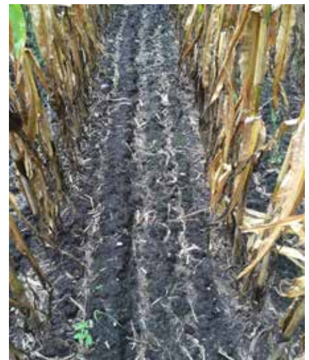
Raaigras – doorgezaaid op kniehoogte – bij de oogst van de maïs. Links: Calaris 1,5 l/ha is veilig. Rechts: Calaris 1,5 l/ha + 0,5 l/ha bodemherbicide is zeer kritisch