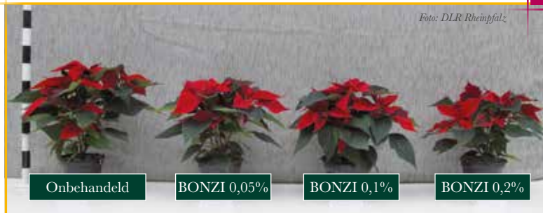
Het effect van BONZI op poinsettia bij verschillende doseringen

BONZI is een zeer effectieve groeiregulator om de vorm, grootte en homogeniteit van planten te reguleren