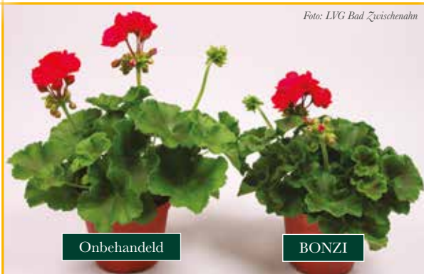
Groeiregulatie met Bonzi in Calliope Dark Red-geraniums.

BONZI geeft in de meest uiteenlopende omstandigheden betrouwbare resultaten.